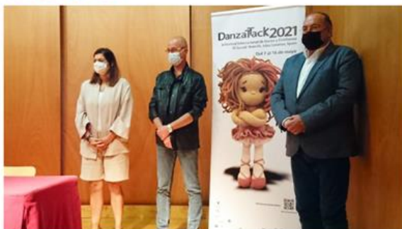
DanzaTTack se presentó este martes en el municipio de El Sauzal, la sede principal del festival.

El Ayuntamiento de El Sauzal fue este martes escenario de la presentación del XI Festival Internacional de Danza y CineDanza, DanzaTTack , que se llevará a cabo del 7 al 16 de este mes en el municipio norteño, así como en Santa Cruz, El Rosario, Puerto de la Cruz y La Laguna. El festival cuenta con la colaboración de la Fundación DISA, el Ayuntamiento de El Sauzal y la participación del Cabildo de Tenerife y el Gobierno de Canarias. La información de las actividades y la venta de entradas está disponible en www.danzattack.com .